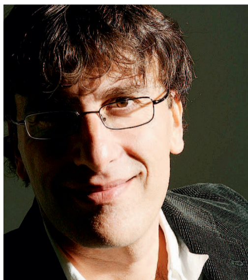
LO SCRITTORE Roberto Cotroneo

■ Termina oggi alla Stazione ferroviaria di Lecce la mostra multimediale «Migranti», ideata dall'assessorato regionale alla Solidarietà e dal Consiglio regionale di Puglia. Tre percorsi per oltre 300 testimonianze provenienti da musei, archivi storici, istituti, fondazioni, ecc. L'esposizione può essere ammirata nel vagone di un treno merci dalle 9 alle 18. Domani, il treno farà tappa a Brindisi, per poi proseguire in altre città italiane.