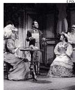
► Foto di scena

«Con Giardino D'Inferno comincia un percorso di sensibilizzazione teatrale volto a riscoprire il valore del Teatro come esperienza sociale collettiva - dice il regista - Un'operazione culturale, quella di riportare