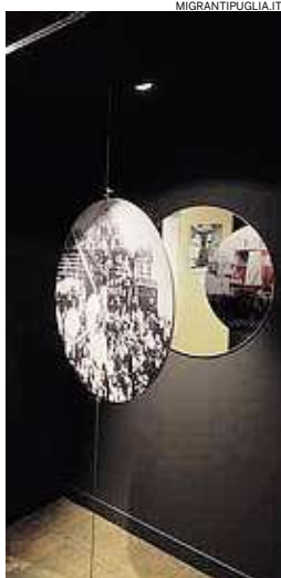
► Un'opera in mostra

LA MOSTRA e il catalogo curato da Farm - con contributi dello storico Vito Antonio Leuzzi, della sociologa Milena Rizzo, del critico cinematografico Massimo Causo e del critico d'arte Massimo Guastella - saranno presentati alla stampa alle 10 sul treno. Oltre 300 sono le testimonianze fotografiche provenienti da musei, archivi storici, istituti, fondazioni, af-