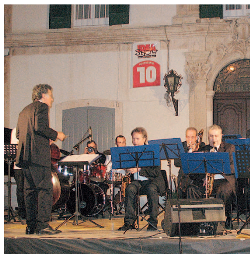
ULTIMO CONCERTO La Small Jazz Orchestra

Si conclude la rassegna parallela alla mostra «Eredità del Novecento-Capolavori della Mazzolini»