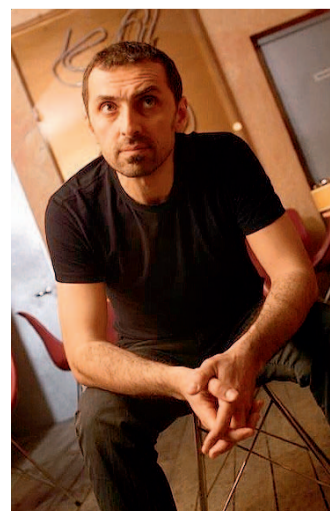
CONSOLI Concerto alle 21.30

Novoli, concerto nella Saletta della Cultura per Tele e Ragnatale