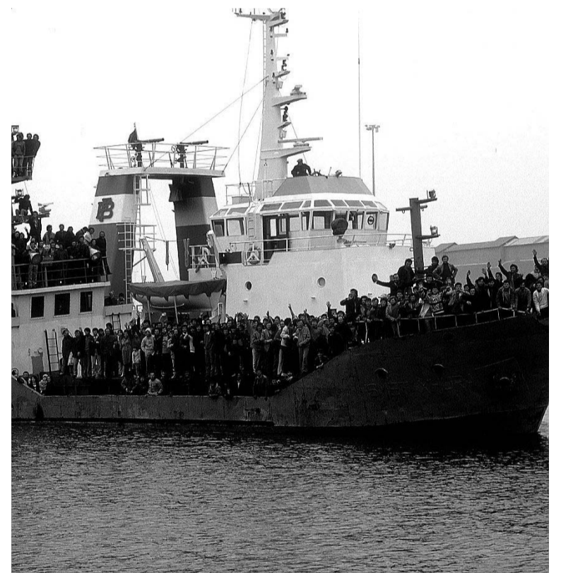
MIGRANTI Foto e video realizzati in collaborazione con Teche Rai e Istituto Luce